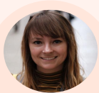
India Lawton University lecturer and post graduate research student in practice-based fine art photography